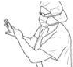
3 Rys. 3-7: Rozprowadź preparat na prawym przedramieniu do wysokości łokcia. Upewnij się, że cała powierzchnia skóry pokryta jest preparatem wykonując kołiste ruchy wokół przedramienia aż do czasu pełnego odparowania preparatu (10-15 sekund).