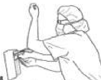
8 Naciskając dozownik łokciem lewej ręki nabierz na prawą dłoń około 5 ml (3 dawki) preparatu do odkażania rąk na bazie alkoholu.