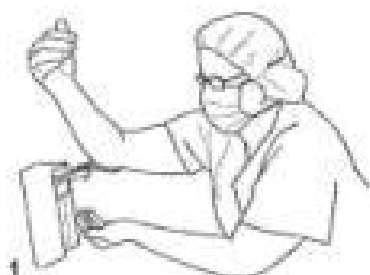
1 Naciskając dozownik łokciem prawej ręki nabierz na lewą dłoń około 5 ml (3 dawki) preparatu do odkażania rąk na bazie alkoholu.

Procedury chirurgiczne można przeprowadzać jedną po drugiej bez potrzeby mycia rąk, pod warunkiem że zastosowano technikę odkażania rąk w celu chirurgicznego przygotowania rąk (rysunki 1 – 17).