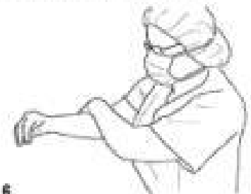
6 Patrz opis do rys. 3