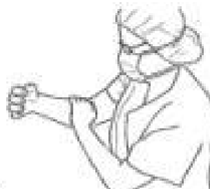
5 Patrz opis do rys. 3