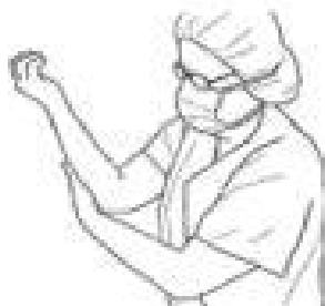
7 Patrz opis do rys. 3