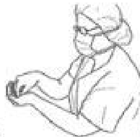
2 Zanurz opuszki palców prawej dłoni w preparacie, aby odkażić powierzchnię skóry pod paznokciami (5 sekund).