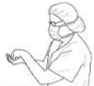
9 Zanurz opuszki palców lewej dłoni w preparacie, aby odkażić powierzchnię skóry pod paznokciami (5 sekund).