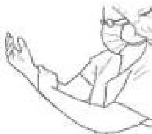
4 Patrz opis do rys. 3